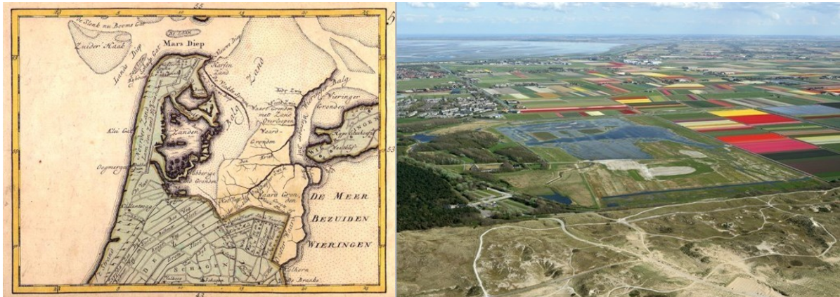
Een historisch en een huidig beeld van het landschap van Julianadorp

De Tweede Wereldoorlog maakte van Julianadorp een onderdeel van de Atlantikwall, een verdedigingslinie van Noorwegen tot aan Spanje. Er werden bunkers, een tankgracht en rijen betonnen punten, zogenaamde 'drakentanden', gebouwd. Bovendien werden veel Duitse soldaten in het dorp ingekwartierd, en kwam er vluchtelingen uit het gebombardeerde Den Helder. Dit veranderde het landschap ingrijpend, hoewel het dagelijks leven in Julianadorp zo normaal mogelijk doorging. Na de oorlog bleken de bunkers moeilijk weg te halen, en nog steeds zijn de sporen van de oorlog zichtbaar in het landschap.