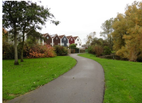
Zicht op het Loopuytpark (het historisch hart van Julianadorp) en een van de woonbuurten.