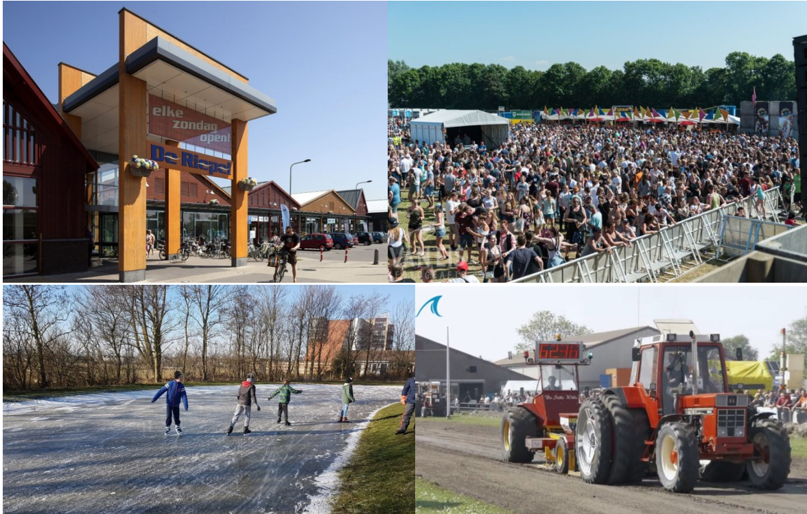
Kenmerkende onderdelen van Julianadorp: met de klok mee: winkelcentrum de Riepel, Julianapop, Julianadorp Power Festival en schaatsen bij de ijssclub