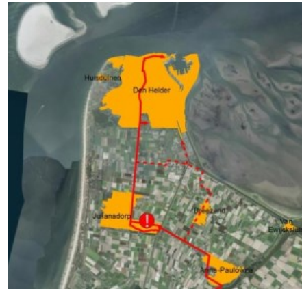
Potentieel netwerk doorfietsroutes rondom Julianadorp

De verbinding voor fietsverkeer tussen Julianadorp en belangrijke werkgebieden zoals Kooypunt en de zuidpoort van het terrein van de Nieuwe Haven (Koninklijke Marine) is op dit moment namelijk matig. Fietsers moeten gebruik maken van de als onprettig ervaren parallelweg langs de N9. Een aantrekkelijke en meer veilige ontsluiting kan gerealiseerd worden door de aanleg van een fietspad over de Middenvliet naar Kooypunt en verder naar de zuidpoort van het Marineterrein. Bijkomend voordeel is tevens dat er op deze wijze een aantrekkelijk oost-westroute wordt gerealiseerd voor recreatief verkeer vanaf Wieringen tot aan de kust (strandslag Falga).