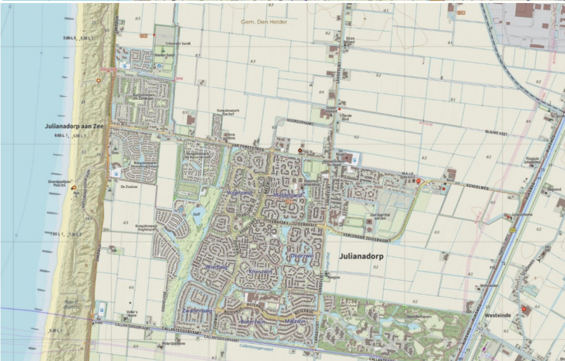
Julianadorp en omgeving in beeld, situatie 2019