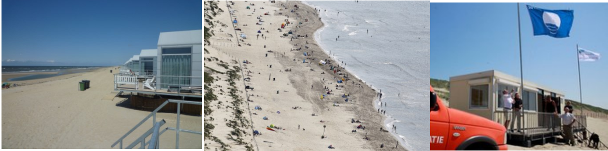
Het kusttoerisme is een belangrijke economische pijler van Julianadorp